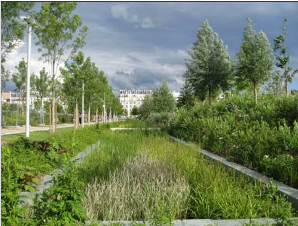
Le fossé humide